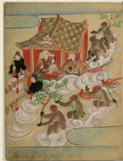
熊野の本地 (室町末期写) 第29巻所収

● 造本 A4判横本・B5判／上製本／クロス装／貼函入 ● 定価 各巻予価(本体三〇,〇〇〇円前後十税) ● 各巻分売可 予約募集! ISBN978-4-8406-9594-7(セット)