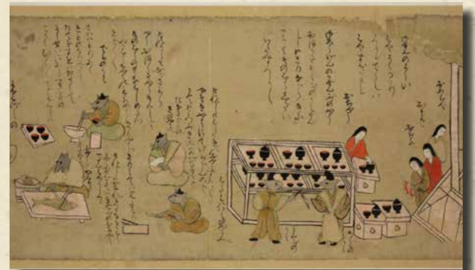
鼠の草紙 (室町末期写) 第23巻所収