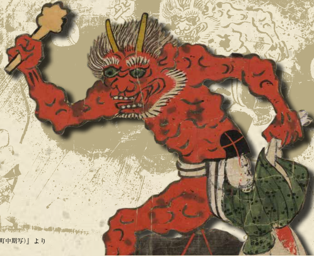
【天神絵巻（室町中期写）より】