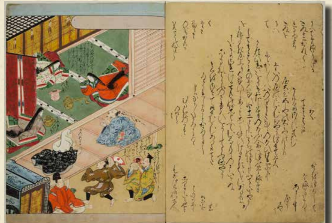
いはやものがたり (室町末期写) 第25巻所収