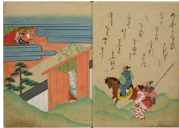
しづか (室町末期写) 第28巻所収