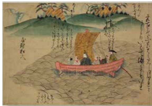
天神絵巻 (室町中期写) 第23巻所収