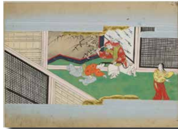
いそざき物語 (江戸初期写) 第26巻所収